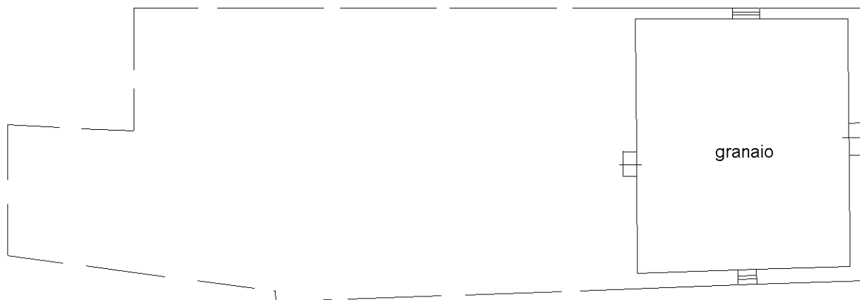
PIANO PRIMO h=2.40