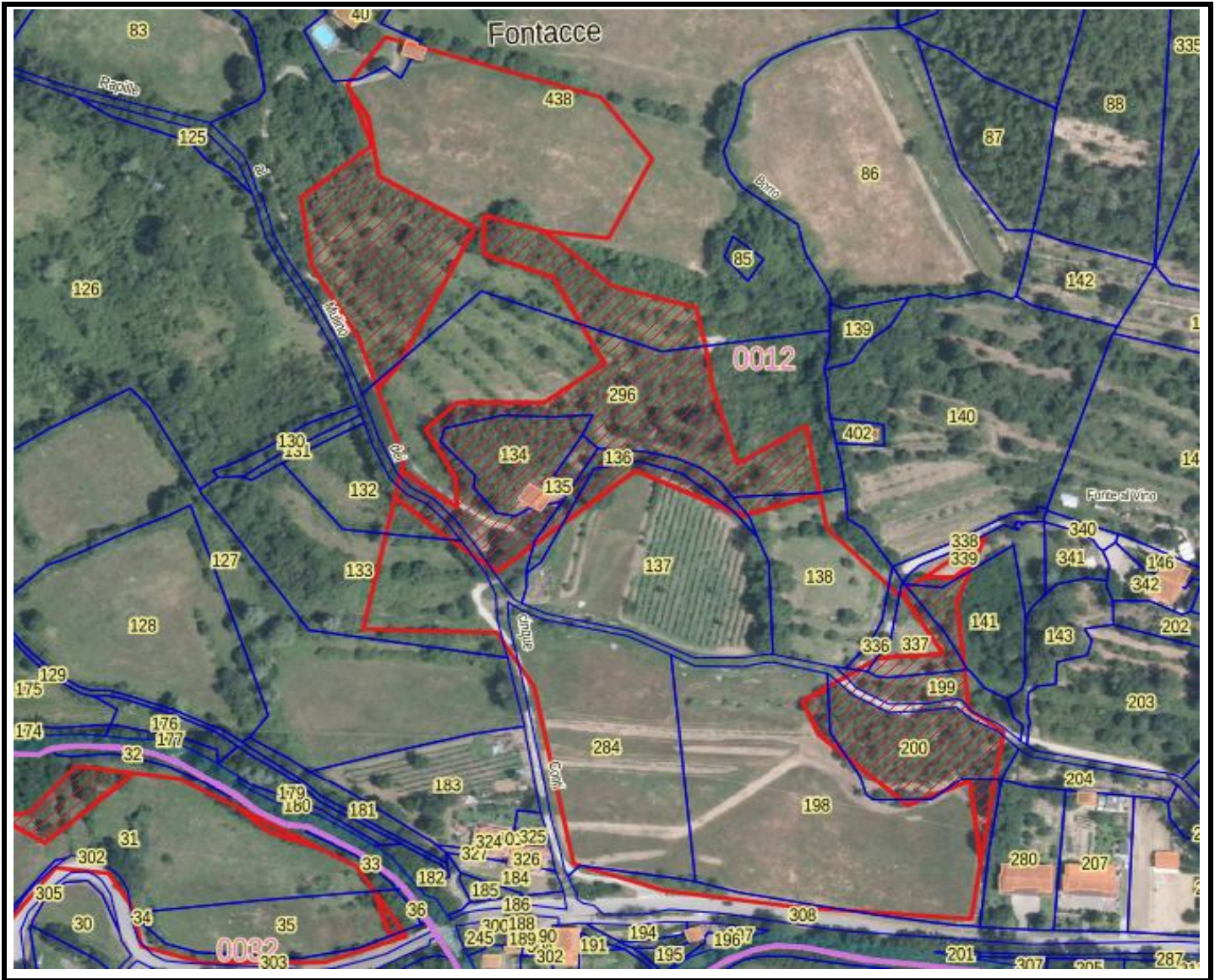
VISUALIZZAZIONE ZONA "B"