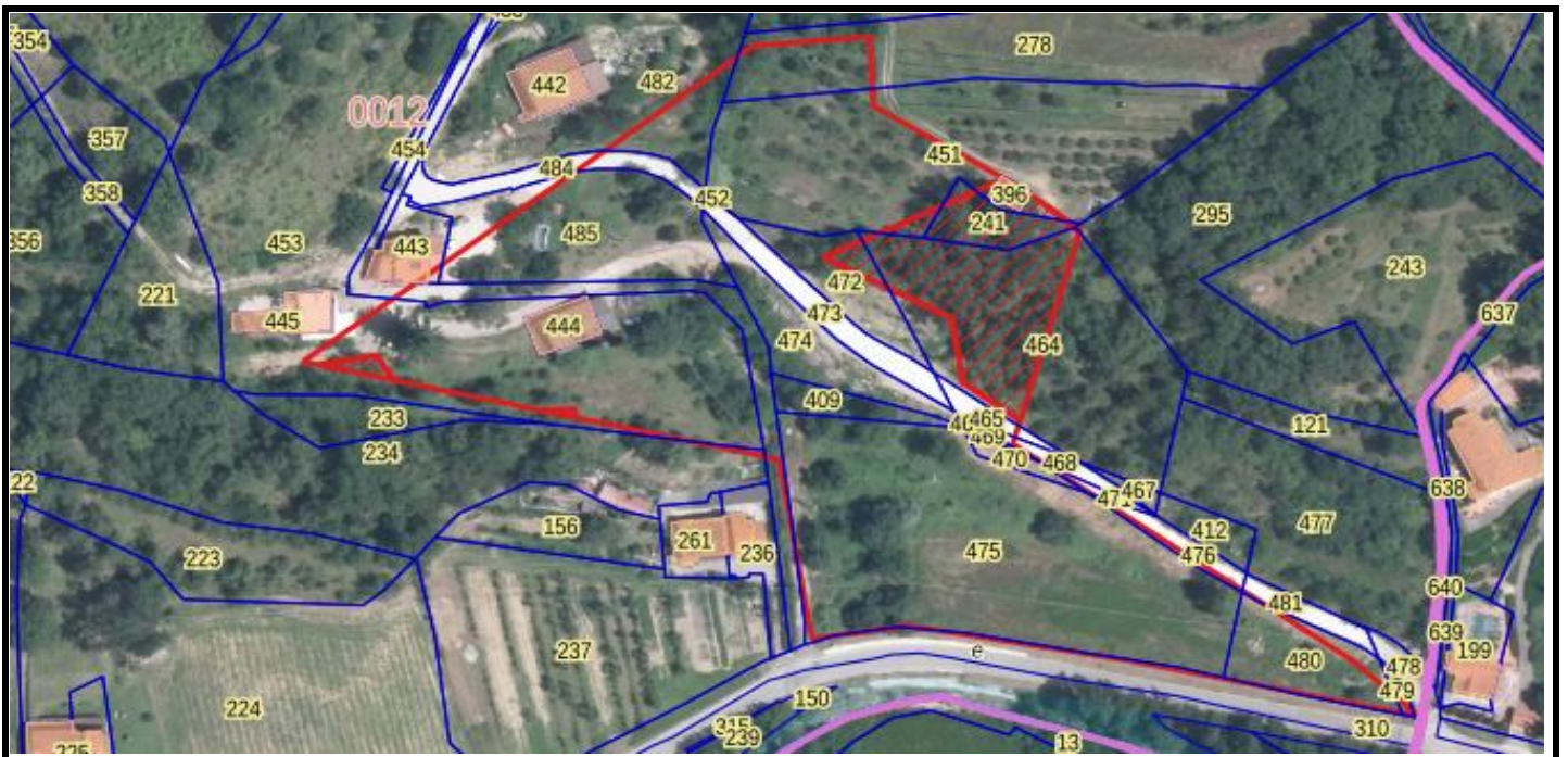
VISUALIZZAZIONE ZONA "C"